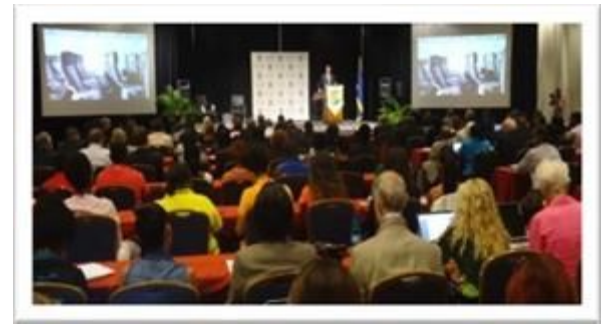
CURAÇAO - CARAÏBES