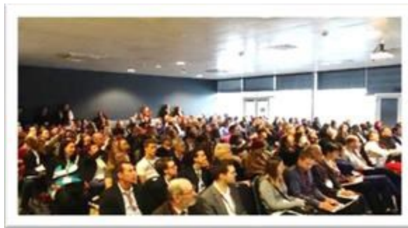
LONDRES – ROYAUME-UNI