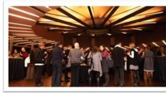
BARCELONE - ESPAGNE