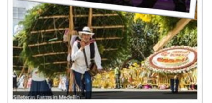
Silleteras Farms in Medellin