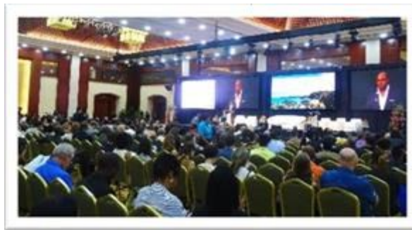
MONTEGO BAY - JAMAÏQUE