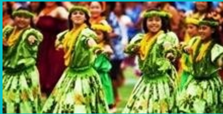
TRADITIONAL DANCE LESSON