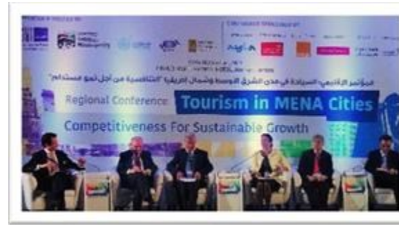
AMMAN - JORDANIE