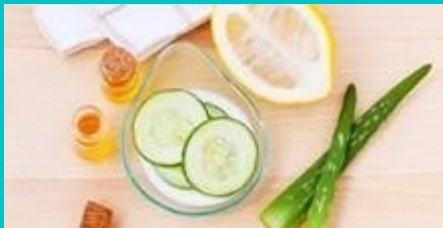
NATURAL COSMETIC WORKSHOP