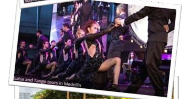
Salsa and Tango tours in Medellin