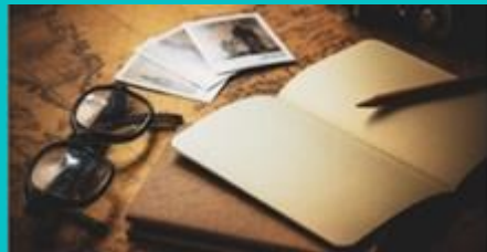
WRITING & POETRY WORKSHOP