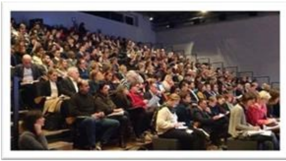
LOUVRE-LENS - FRANCE