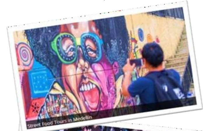
Street Food Tours in Medellin