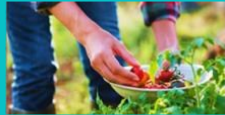
HARVESTING & GARDENING