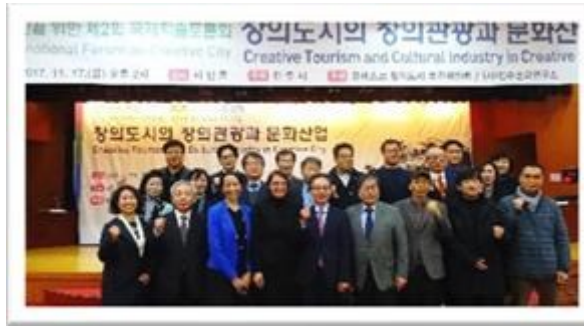
JINJU – CORÉE DU SUD