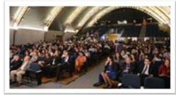
BELO HORIZONTE – BRÉSIL