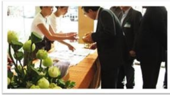
BANGKOK - THAILANDE