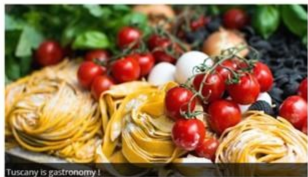
Tuscany is gastronomy!