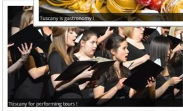
Tuscany for performing tours!