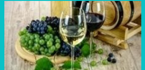
WINE MAKING & TASTING