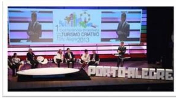
PORTO ALEGRE – BRÉSIL