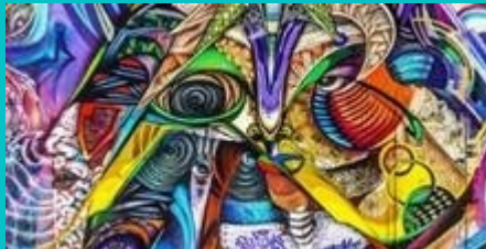
STREET ART INITIATION