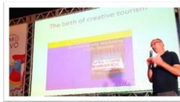
RECIFE - BRÉSIL