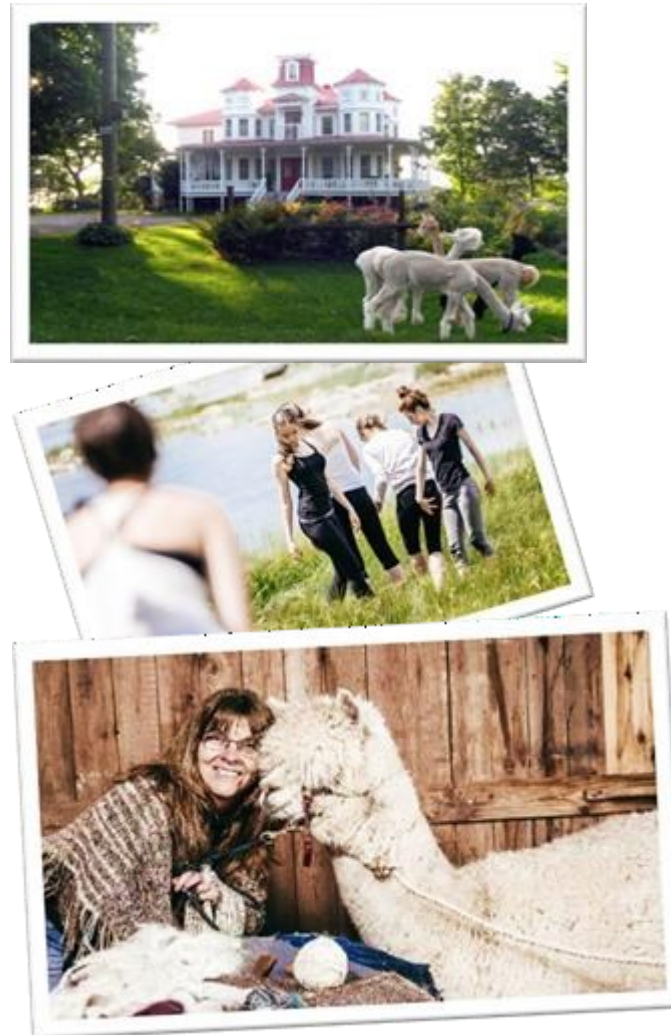
QUÉBEC, TOURISME CRÉATIF